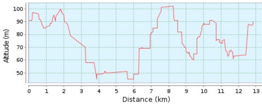
Højde profil (45 m til 102 m)