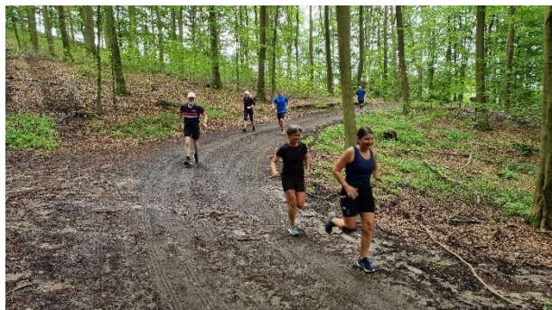
Smattede stier og skovveje er ikke til at undgå – men det går jo fint alligevel

for at høre og det var Ok, at vi brugte "hans skov". Dette fik vi heldigvis lov til, hvis vi kun brugte de større stier. Dette var af hensyn til vildtet.