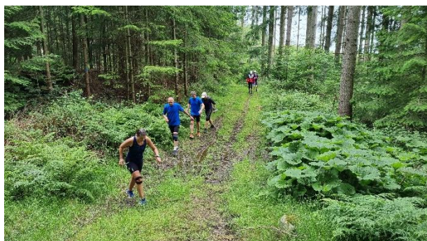
Det går jo alligevel ... også når plørehuller passerer

Dagene op til bød bare på regn og vejudsigten denne søndag var heller ikke for god. Der var 24, som havde lyst til at tage med på denne tur.