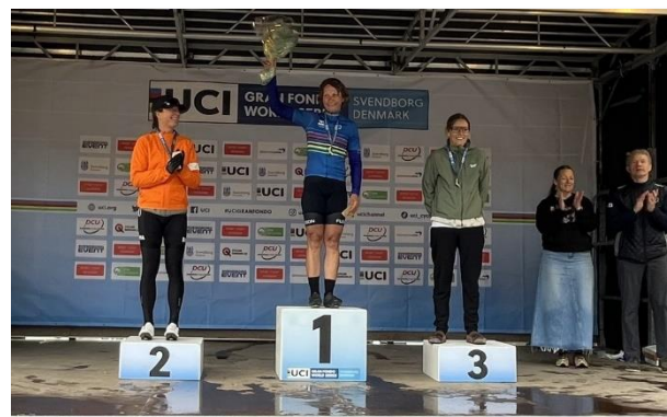
Charlotte, flot 2'er på skamlen i Svendborg

Det blev hurtigt koldt at stå i målområdet, og