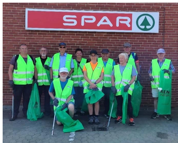
Holdet klar til indsamling af affald i Nørre Broby

FSM til byder Core and Mobility samt svømning ligesom tidligere år, bestyrelsen har besluttet at reducere tilskuddene til de