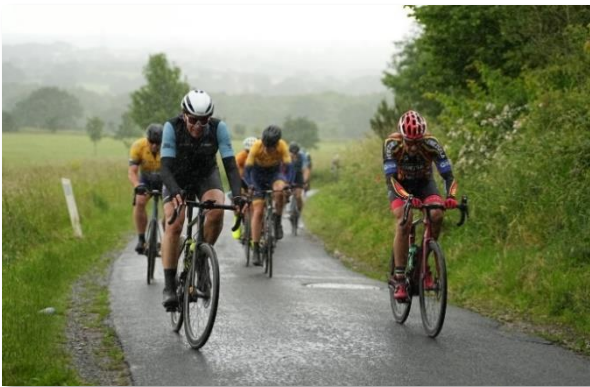
Rent ud sagt et værre møgvejr, som her på Golfbakken

Som turen skred frem med en velfungerende gruppe og egne ben, der fortsat drejede fint rundt og havde overraskende overskud, så hjalp det jo også på både bekymringsniveau og troen på, at jeg skam nok skulle komme hel og velfornøjet retur til Svendborg.