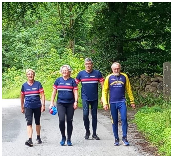
Sidste meter inden sandwich og hyggestund med de andre hold

Efter turene i skoven, samles vi alle på p-pladsen til en velfortjent sandwich og en øl/vand. Det blev en dejlig formiddag uden for det sædvanlige område.... Og vejret??? Jo, det var tørvejr endda med lidt sol.