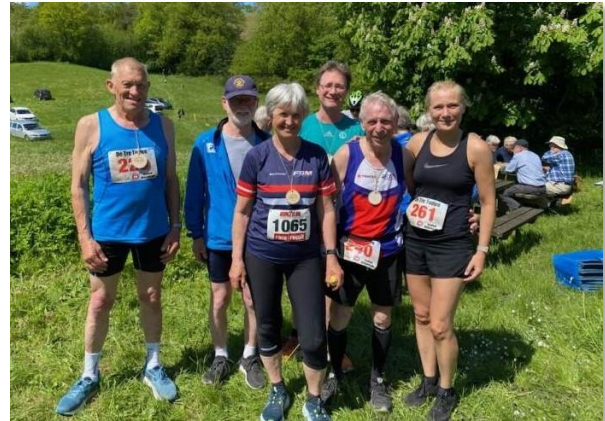
Efter veludført dåb på De tre toppe

Han havde en hjælper med, som passede depotet. Ruten havde han selvfølgelig mærket op, men der var ingen hjælpere ude på ruten, så vi måtte selv åbne og lukke alle låger. Desuden måtte vi selv tage tid og ikke mindst tælle omgange.