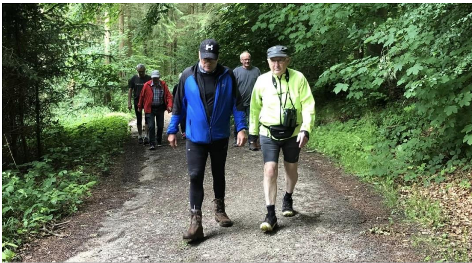
Gåholdet (vistnok) på Øhavsstien i Nørreskoven på ud-af-huset turen til Holstenshuus

FSM skal stå for det 3. løb i serien, som er den 24. november. Dette hører du meget mere om, for der skal igen bages kager og bruges hjælpere denne dag.