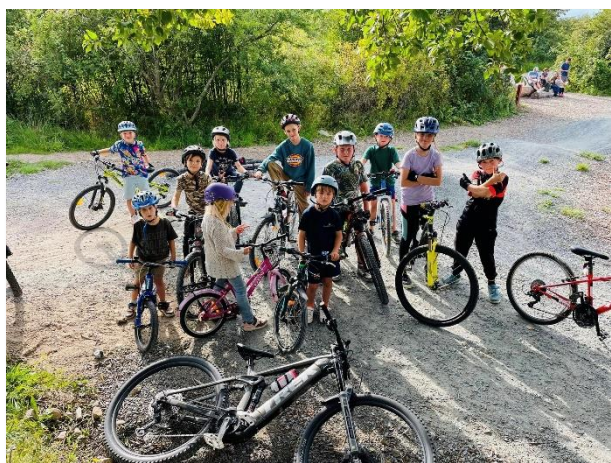
Samling for nye instruktioner inden det går løs igen