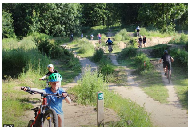
Fra Ungdomsholdets sommerafslutning i Glamsbjerg Bikepark

På nu 3. år kører afdelingen en imponerende indsats for børn og ungdommer – alene antallet på næsten 80 u/18 medlemmer siger det hele. Kom og oplev det hele selv – eller tag del i det, der kan altid bruges en frivillig hånd mere. Tirsdage er det børn (kl. 16 til 17) og onsdage ungdommerne (16.30 til 18.00). Her blot et lille potpourri.