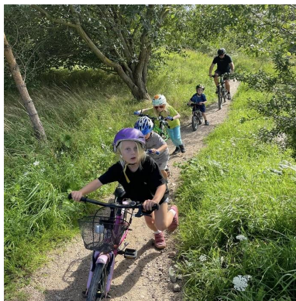
Man må slide lidt i det før man kan få suset ned af bakkerne