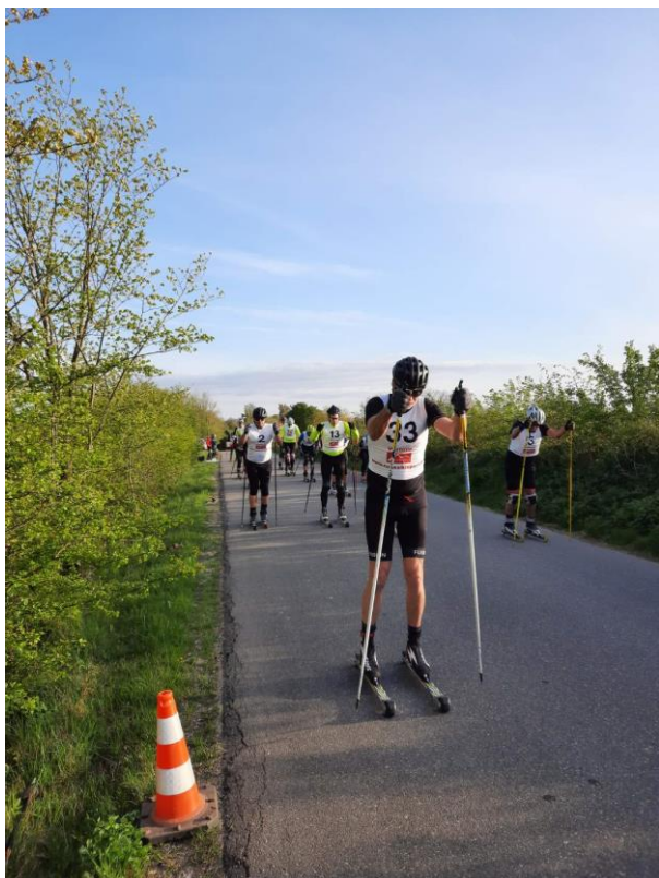
Her går starten i Vejle