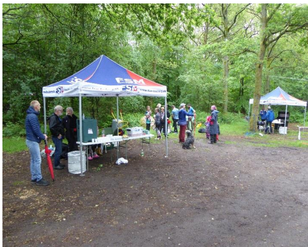
Hygge på ruten

Her kan samles kræfter til den næste stigning – Op til trolden Finn. – Derefter går det ned af trappen og gennem slugten til den sidste stigning, nok den hårdeste af dem alle. – Når vi endelig er oppe, er det om til lågen ved flagstangen og du kan herefter skifte stævnepladsen.