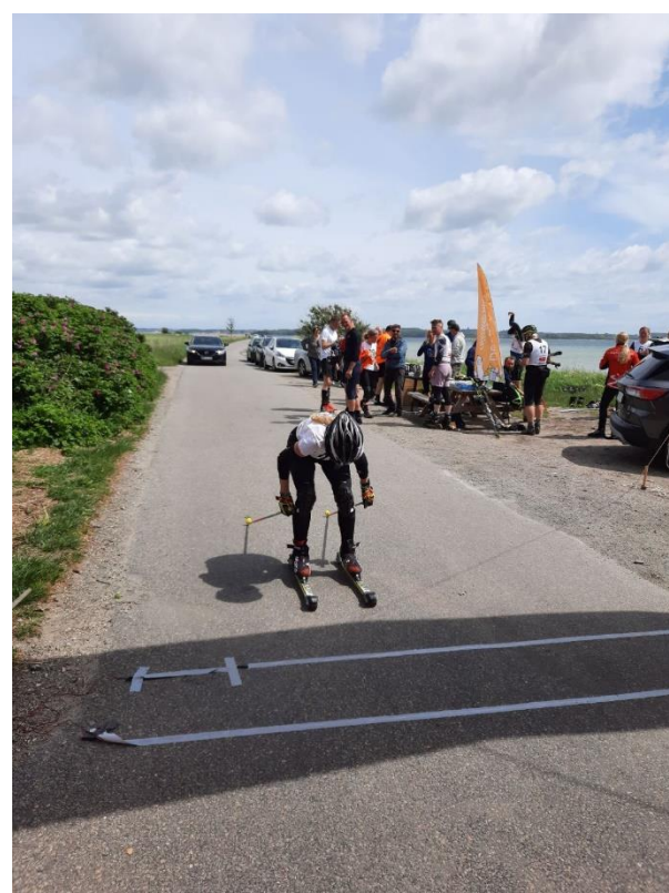
Mål i Svendborg