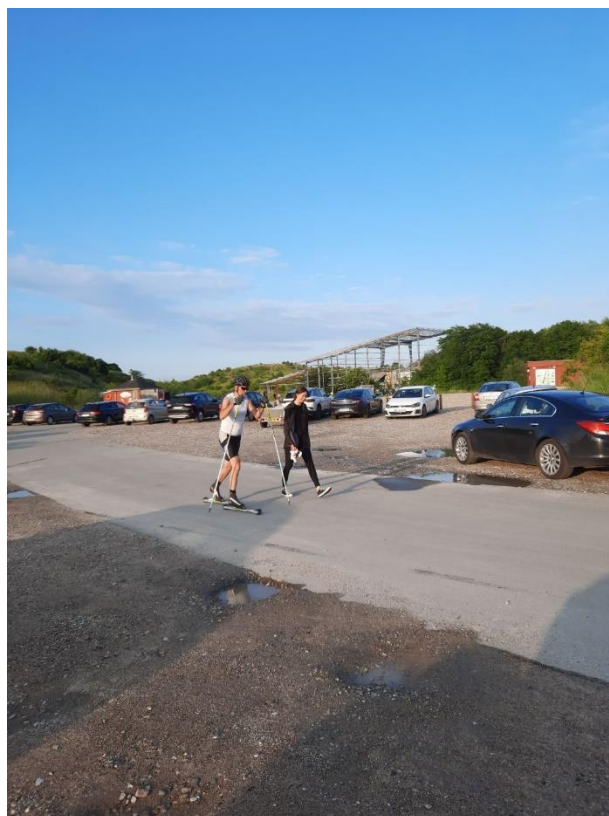
Far og datter fra Aalborg Skiklub