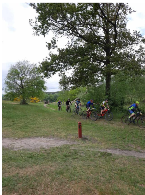
Så er starten i motion gået