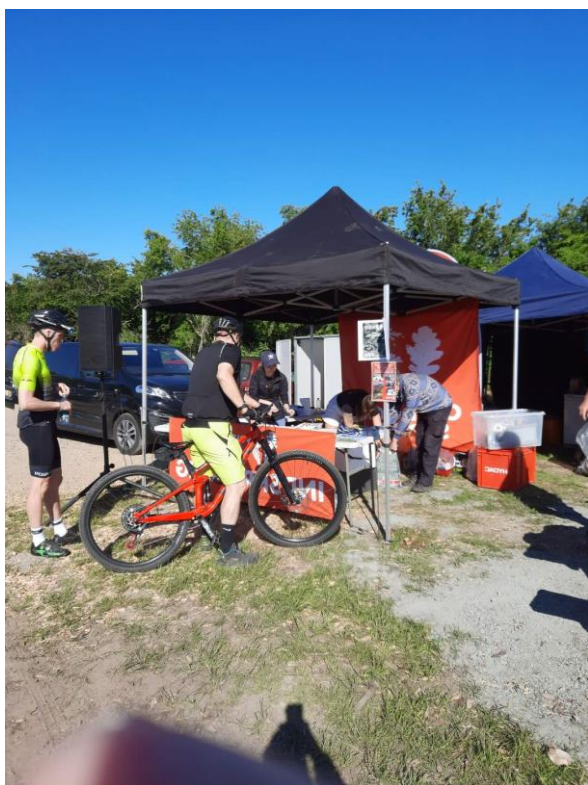
Outdoor Sydfyn 2022

Den lange rute fortsatte ned til Svanningevej, ad græssporet, rundt om Svanninge Kirke, op ad Højbolund, tv langs Golfbanen og ud på Hammerdamsvej, til toppen af Højbolund, derefter tv ad Golfbanen og ind på Det Blå Spor, over Golfbanen og ind på Auken Stien, ned ad Odensevej, ind i bakkerne ned til målet.... Og så en omgang mere. Løbet sluttede ca. kl. 13:45