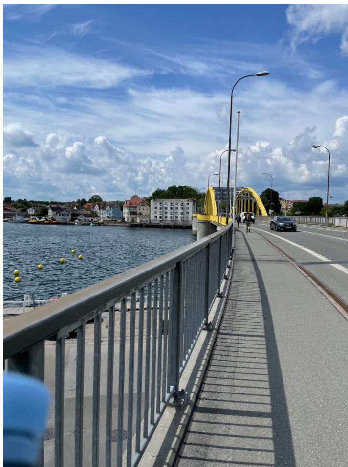
Sønderborg – Den gamle bro

Vi ramte – igen – 9. klassernes sidste skoledag, og det gik ikke stille for sig. Sønderborg Slot var samlingsstedet for de mange udklædte / overgivne / halvberusede unge. Det var ikke blot byens ungdom, der var udklædte. Sønderborg forbereder sig til Tour de France. Den gamle bro var beklædt med gult stof – man må formode, at der er forbud mod at hejse broklapperne op, når (og hvis) feltet skal forbi.