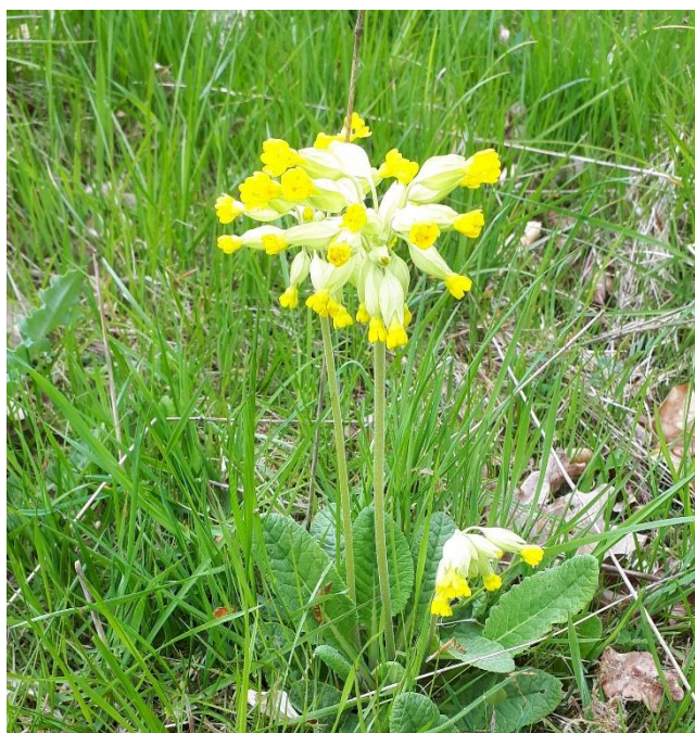
På den gule sti

Jeg synes ruterne er godt afmærkede, men må da indrømme, at jeg en enkelt gang er gået forkert, fordi jeg plejer, at deje til venstre her og ikke gå lige ud!! – En anden gange missede jeg en pæl, om det var forbi græsset var højt, eller om det var, fordi vi normalt ikke bruger denne sti, ved jeg ikke.