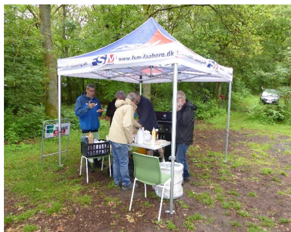
Pølser til medhjælperne

Den sidste løber kom i mål efter 5 timer 47 min, men så havde han også løbet 50 km.