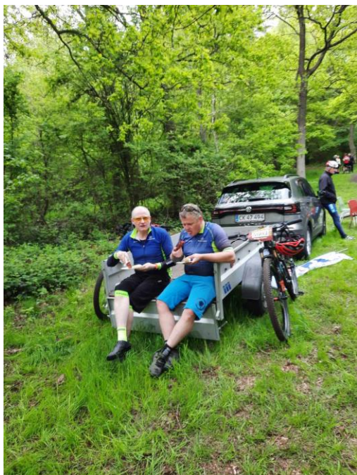
Efter løbet er der ristede pølser