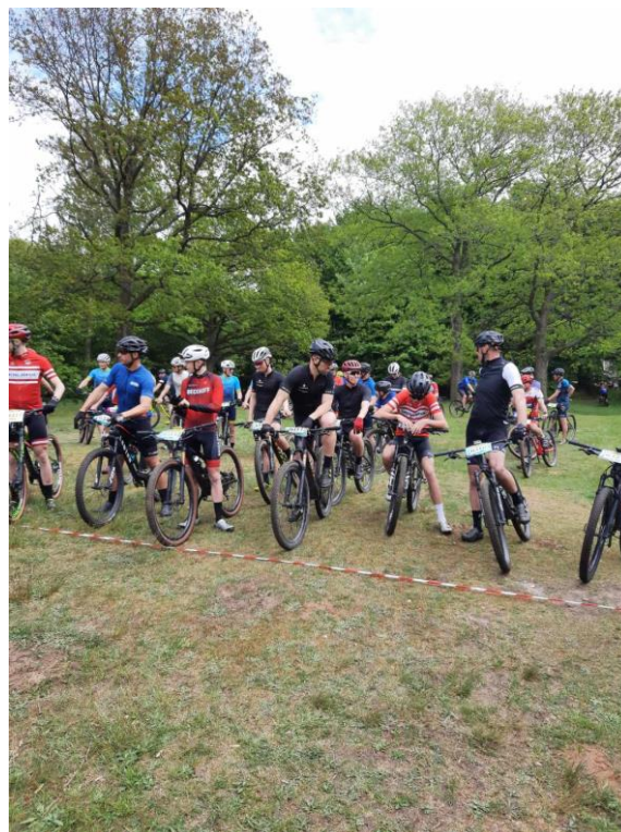
Klar til start i sport og elite

Efter en lang dag, som sluttede ca. kl. 16, kunne de frivillige medlemmer drage hjem til familierne, og berette om en god dag på Det Blå Spor i en smuk Svanninge Bakker.