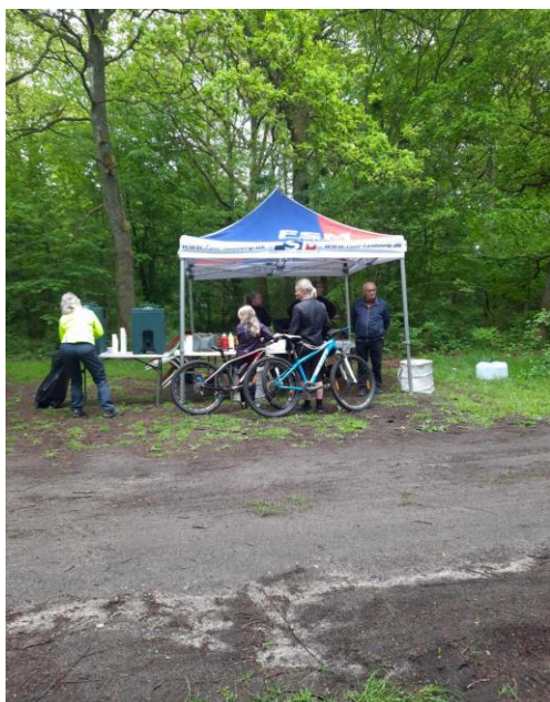
Forplejning af mor og datter