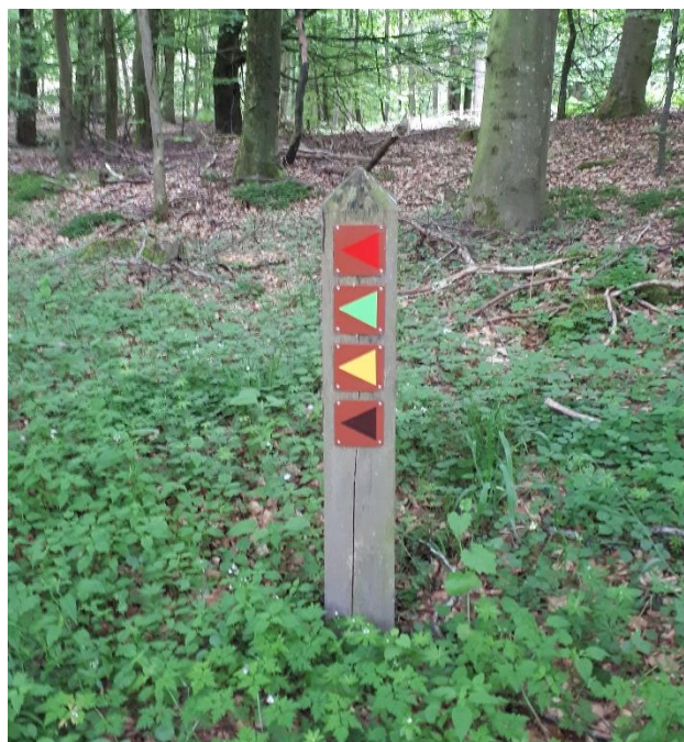
Hvilken sti skal jeg vælge

Der er kort over ruterne ved alle P-pladser rund ved de store veje i området. – De angivne km. passer godt med det oplyste. (Dog er den nævnte brune rute opmærket med sorte skilte).