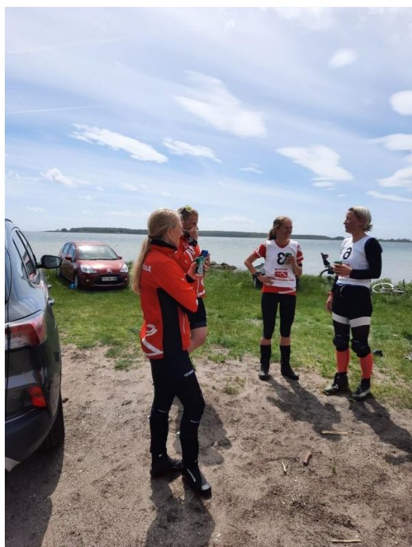
Pigesnak i Svendborg